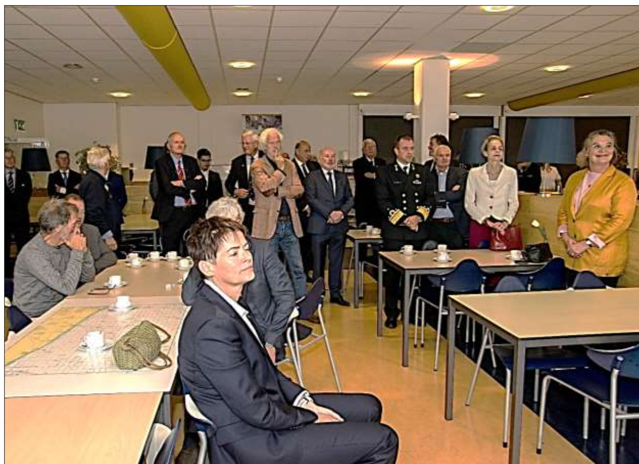
Deelnemers aan de herdenkingen in restaurant 't Opperdje van Enys House...