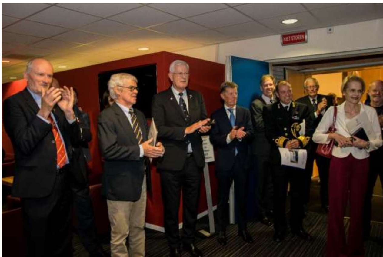
Waardering van aanwezigen voor de organisatie van de herdenkingen...