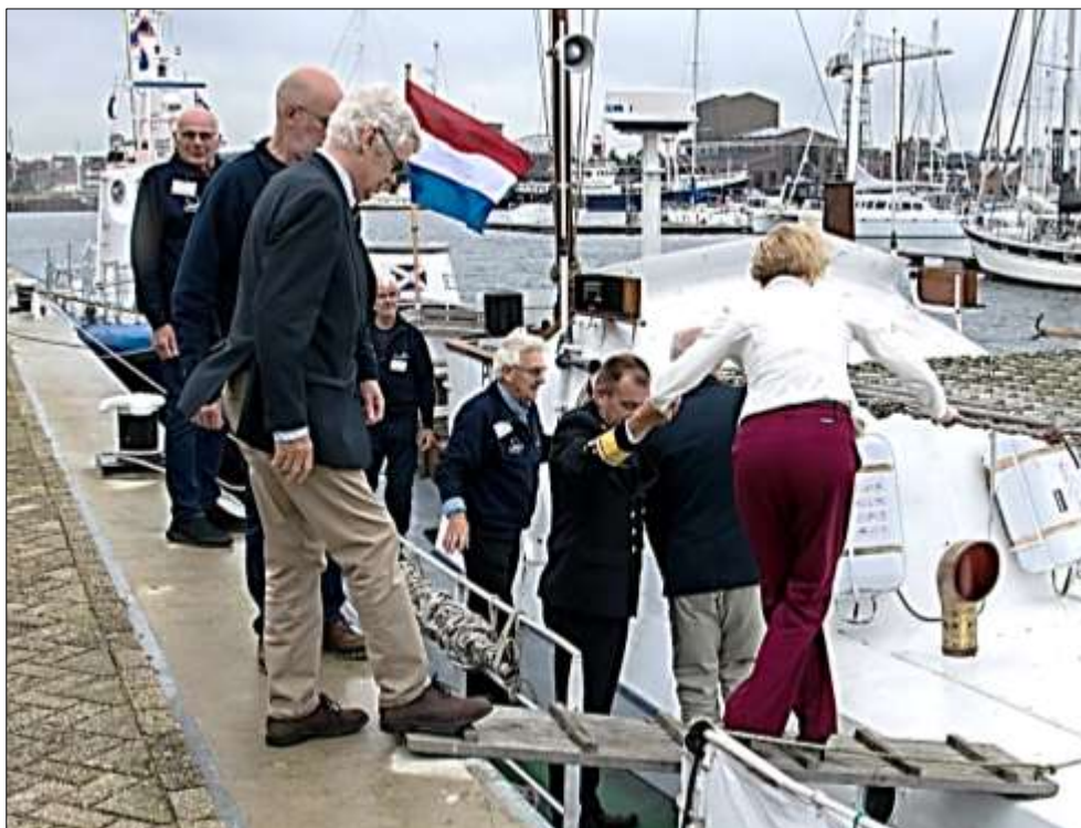
Voorzichtig aan boord van de 'Dorus' gestapt.